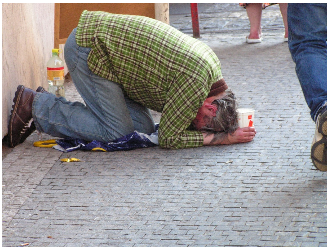
Tigger, Prag.

Fonden projekt UDENFOR Ravnsborggade 2, 3. sal 2200 København N